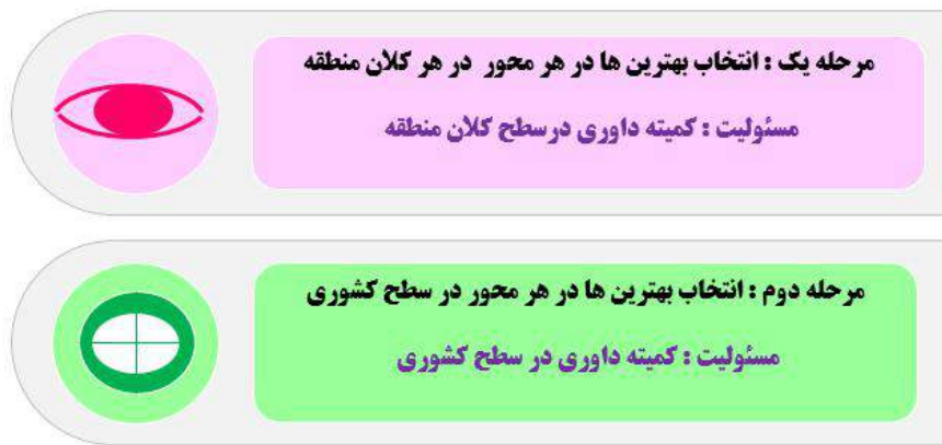
شکل شماره دو : مراحل انتخاب برگزیدگان در برنامه بهترین ها

در برنامه حاضر سعی خواهد شد که برگزیدگان در هر محور هم در سطح کلان منطقه و هم در سطح کشوری به صورت مجزا معرفی شوند. انتظار بر این است انتخاب برگزیدگان طی دو مرحله مطابق شکل شماره دو انجام پذیرد.